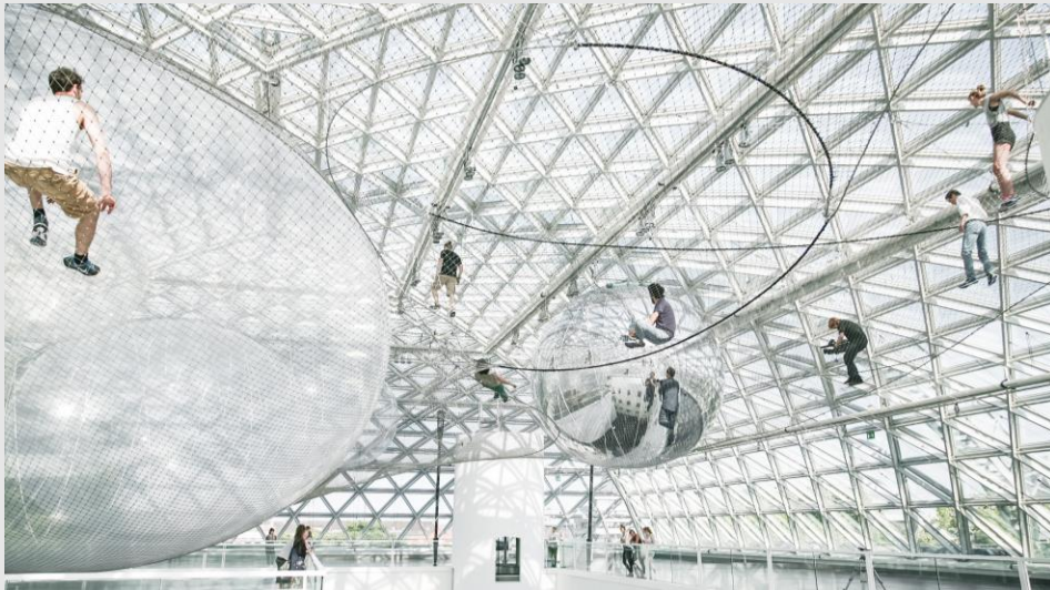
© Studio Tomás Saraceno 2013 © Kunstsammlung NRW